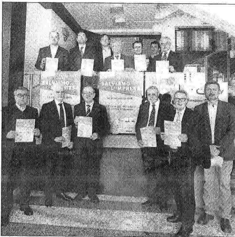
Associazioni insieme all'insegna di "Salviamo l'impresa". SERVIZIO a pagina 5

RAVENNA. Contano di portare in piazza oltre mille persone per manifestare in difesa dell'economia reale del territorio. Tutte le associazioni imprenditoriali (ben tredici), in rappresentanza dell'agricoltura, dell'artigianato, del commercio, del turismo dell'industria e della cooperazione, hanno deciso di marciare compatte all'insegna del "Salviamo l'impresa". Che la crisi stia soffiando forte lo si capisce anche da iniziative come questa. Al momento unica esperienza in Italia. Del resto il "bollettino di guerra" dal fronte economico a livello locale parla di circa venti imprese che chiudono ogni giorno. Dal 2010 al 2012 si sono perse 400 aziende, i disoccupati sono aumentati del 25%; i lavoratori in mobilità del 20% ed è cresciuto del 9,8% il numero di ore di cassa integrazione e del 9,1% il ricorso alla Cassa integrazione in deroga. Una situazione drammatica che vede le aziende "ridotte allo stremo". Per questo, fatto unico nella storia imprenditoriale ravennate, le delegazioni di Agci, Cia, Cna, Coldiretti, Confagricoltura, Confimi,