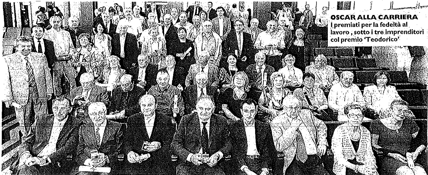
OSCAR ALLA CARRIERA I premiati per la fedeltà al lavoro, sotto i tre imprenditori col premio 'Teodorico'