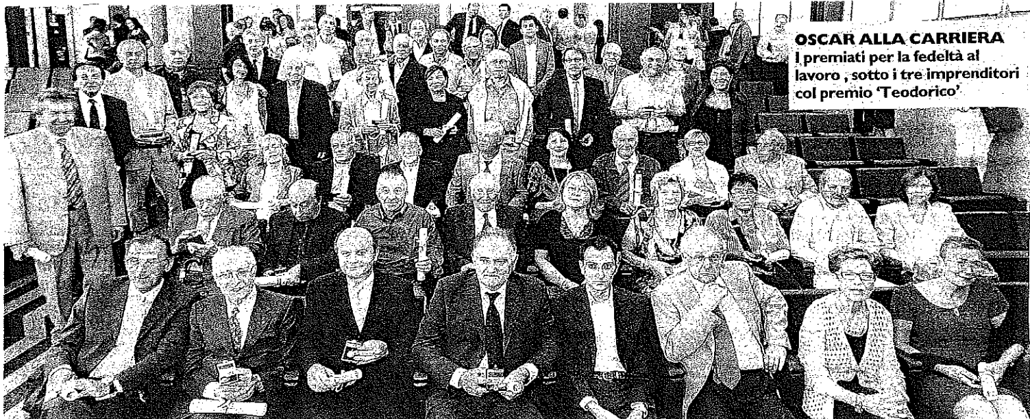
OSCAR ALLA CARRIERA I premiati per la fedeltà al lavoro, sotto i tre imprenditori col premio 'Teodorico'